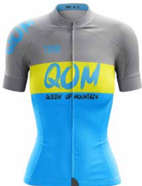
GR20 Gris / Grey