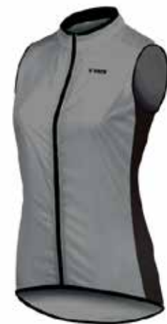
05CHL86 - REF