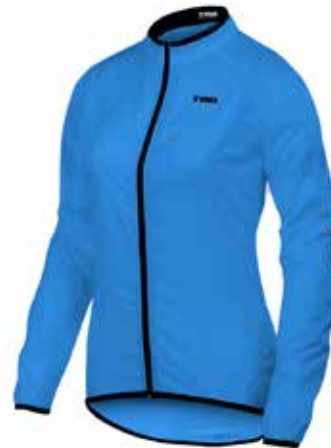
CE20 Celeste / Light blue