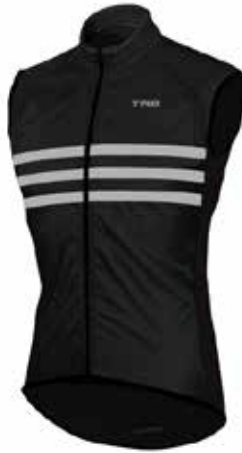
05CHL61 - NEG