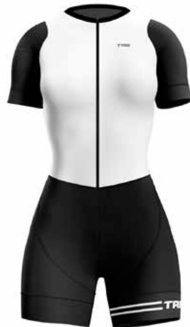
BL20 Blanco / White