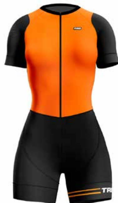
NA20 Naranja / Orange