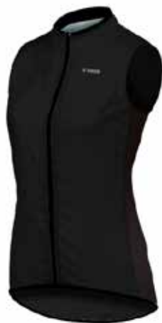
05CHL81 - NEG