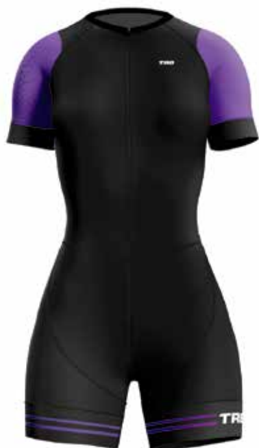
M020 Morado / Purple