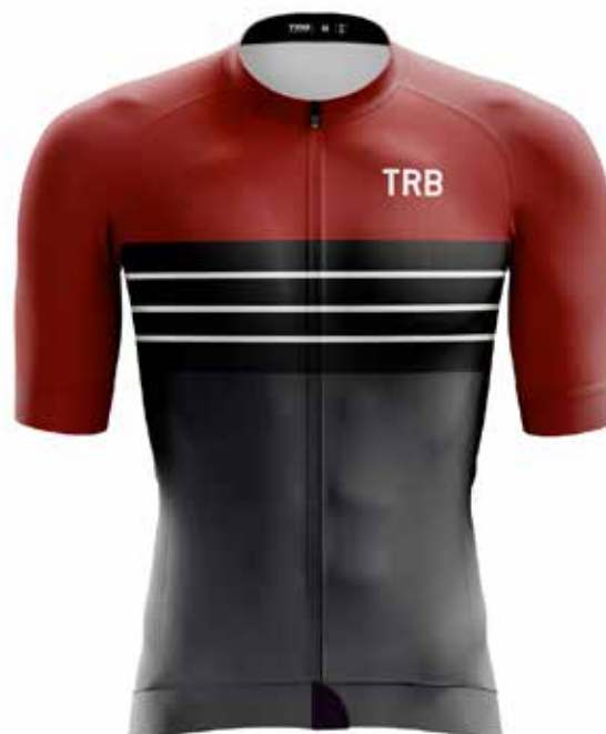
VT20 Vino tinto / red wine