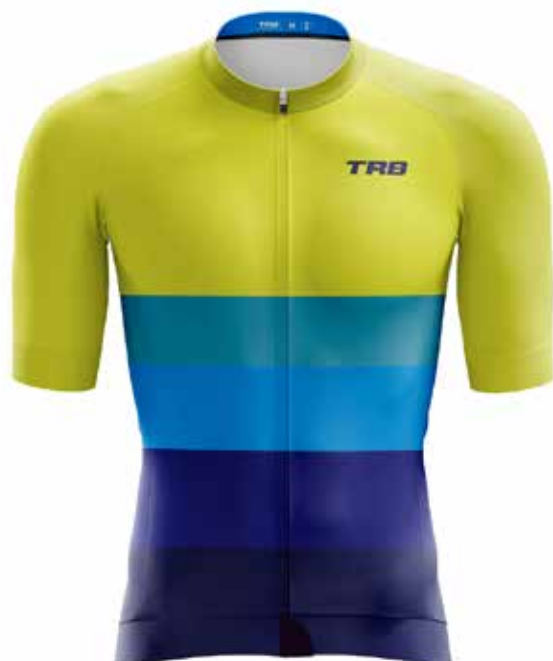
VA20 Verde neon / fluor