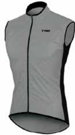
05CHL71 - REF