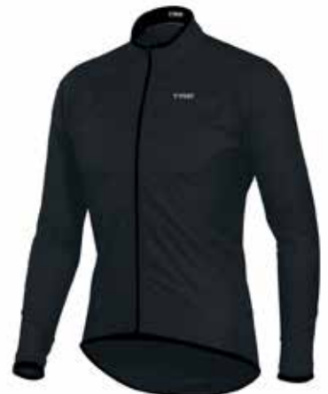
NE20 Negra / Black