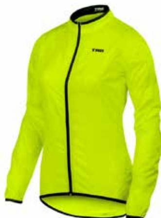
VE20 Verde neon / Fluor