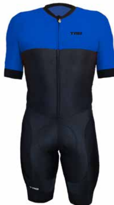
AZ20 Azul / Blue