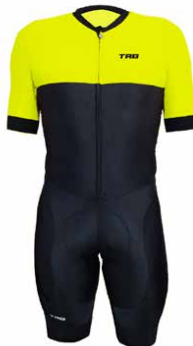
VE20 Verde neon / Neon green