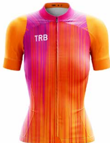
NA20 Naranja / Orange