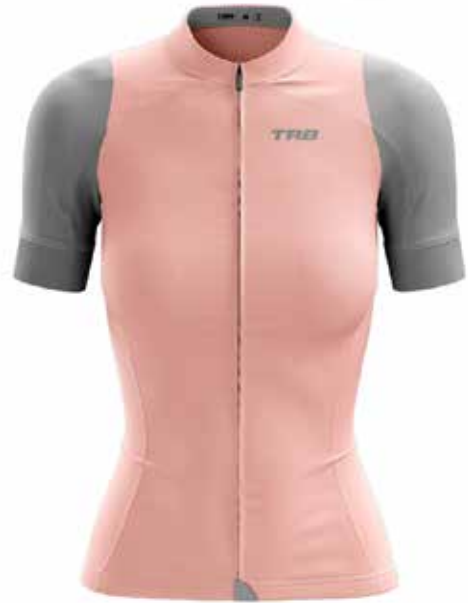
RS20 Rosado / Pink