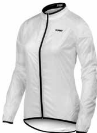
BL20 Blanca / White