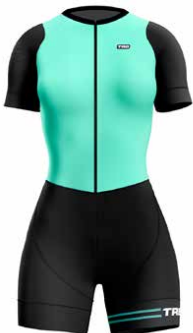
CE20 Celeste / Light blue