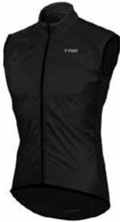
05CHL51 - NEG