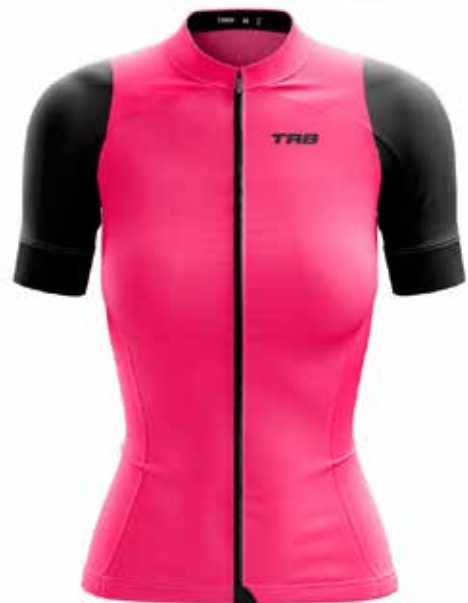
FU20 Fucsia / Fucsia