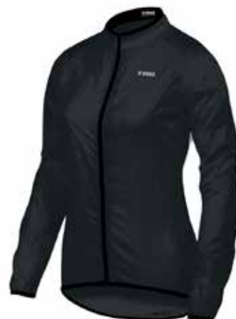
NE20 Negra / Black