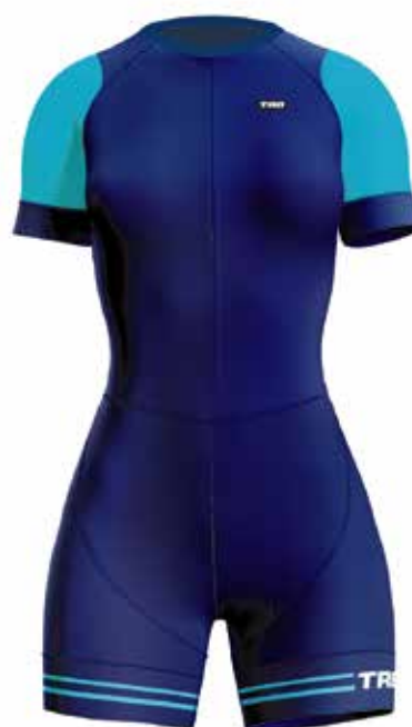
A020 Azul / Blue