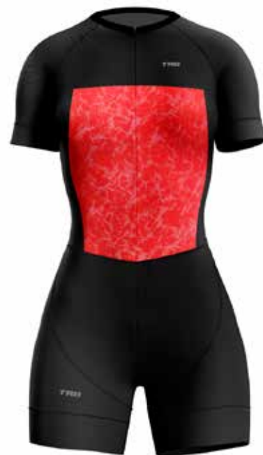
MG19 Fucsia / Fucsia