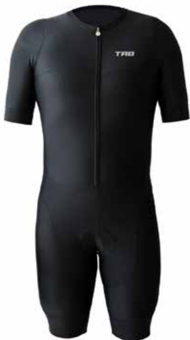
NEG Negro / Black