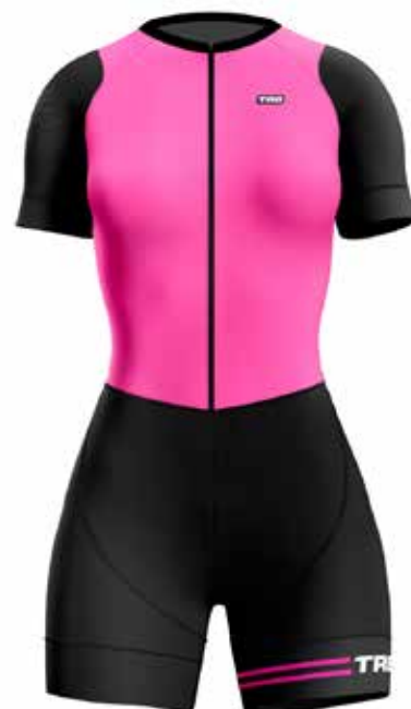
FU20 Fucsia / Fucsia