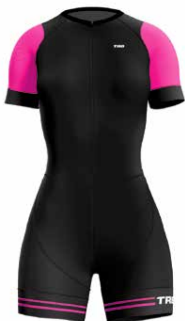
FU20 Fucsia / Fucsia