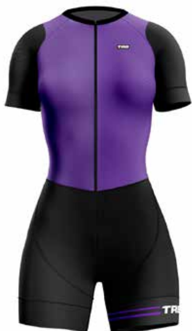
M020 Morado / Purple