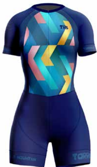
AZ19 Azul osc / Navy