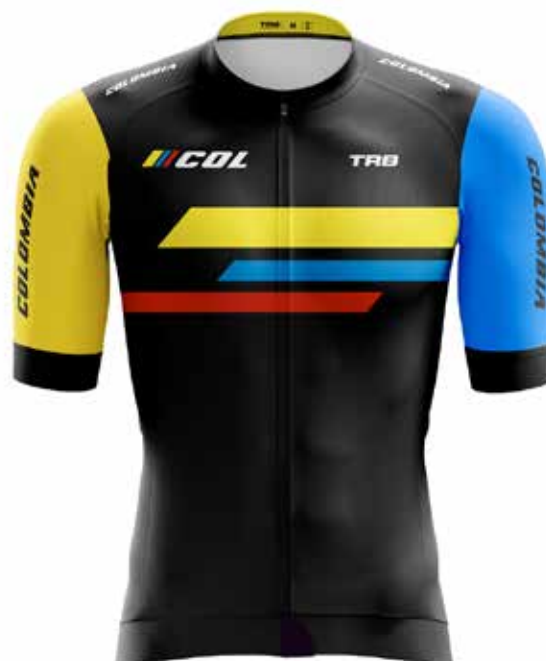
C020 Colombia / Colombia