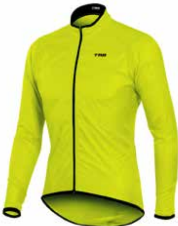
VE20 Verde neon / Fluor