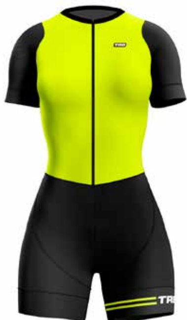
VE20 Verde neon / Green fluor