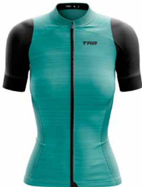
CE20 Celeste / Light blue