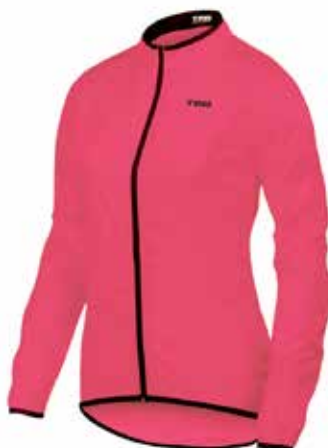
FU20 Fucsia / Fucsia