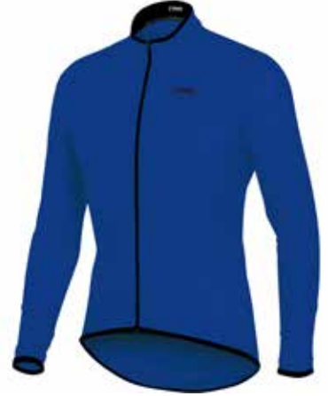
AZ20 Azul / Blue