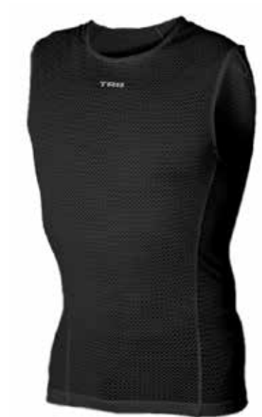
NE20 Negro/ Black