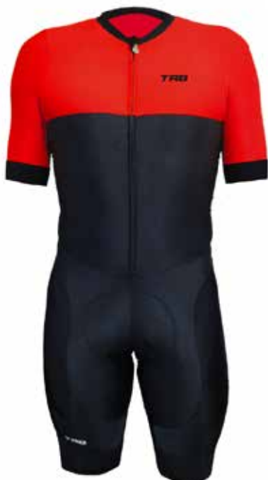
R020 Rojo / Red