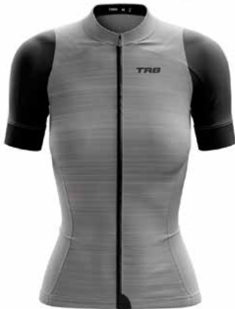
GR20 Gris / Grey