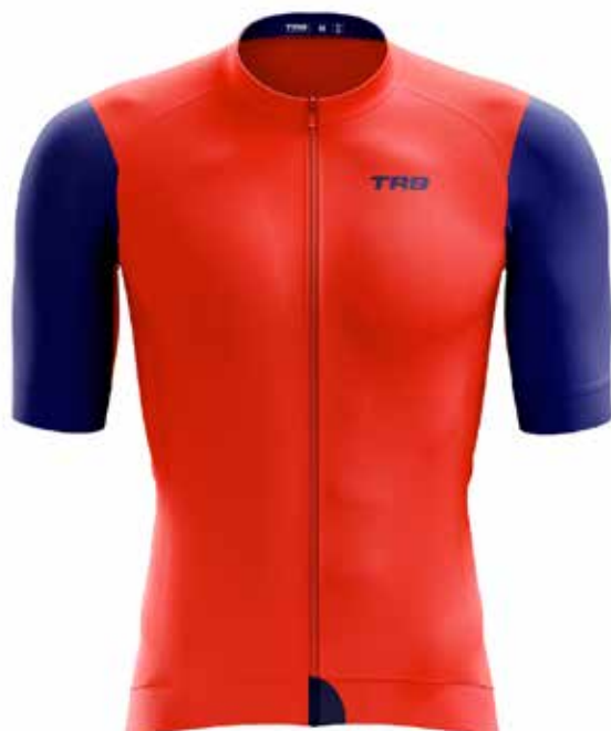
R020 Rojo / Red