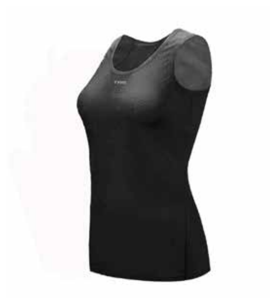
NE20 Negro / Black