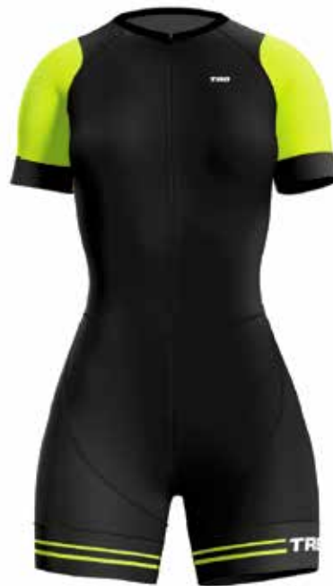
VE20 Verde neon / Neon green