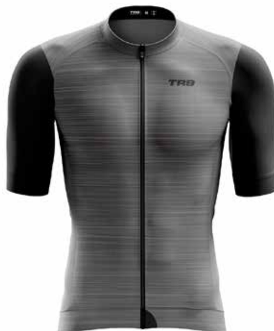
GR20 Gris/ Grey