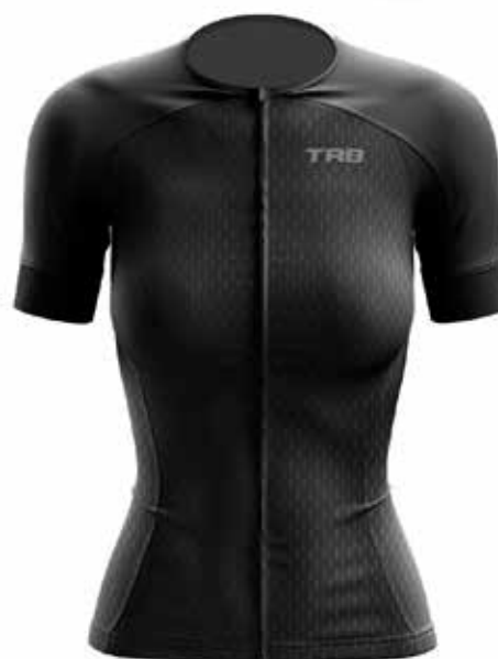
02ELT81 Negro / Black