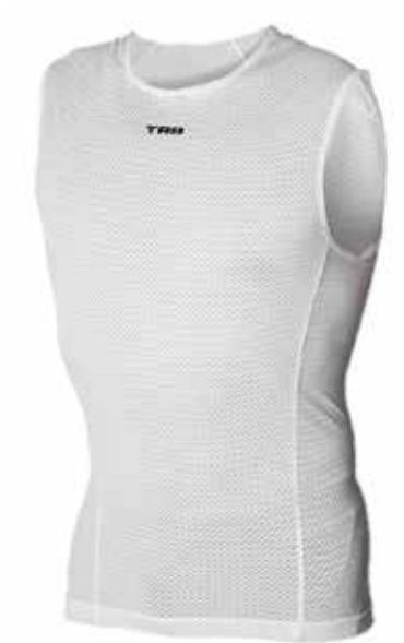
BL20 Blanco / Blanco