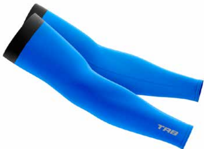
MANGUILLAS PRO COD. 11LYC61