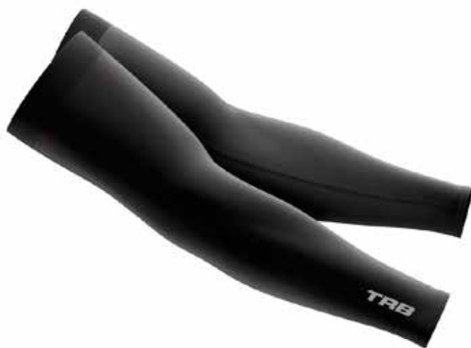
MANGUILLAS ELITE COD. 11LYC71

Tallas S / M / L Colores: Azul / Rojo / Blanco