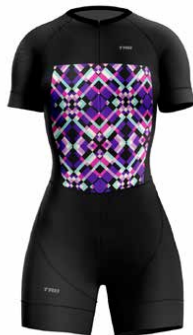
M019B Morado / Purple

** descuento aplica unicamente para modelos 2019