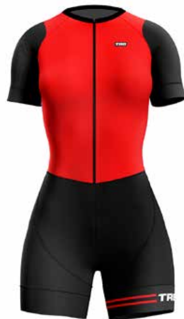
R020 Rojo / Red