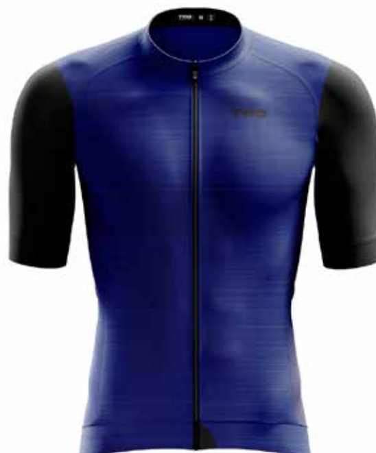
AZ20 Azul / Blue