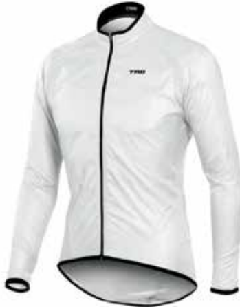
BL20 Blanca / White