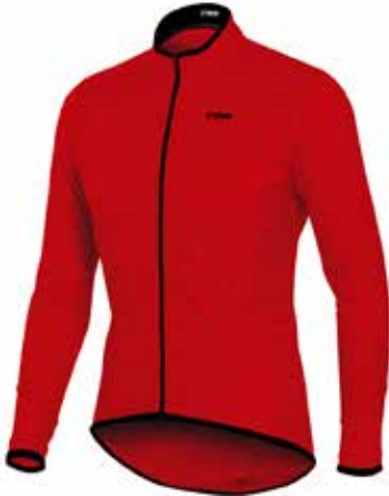
R020 Rojo / Red