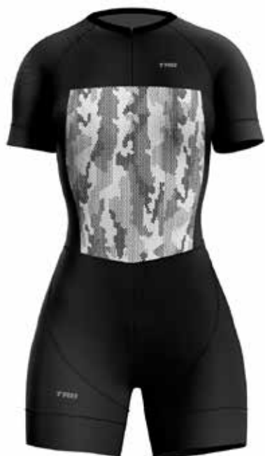
GR19B Negro / Black