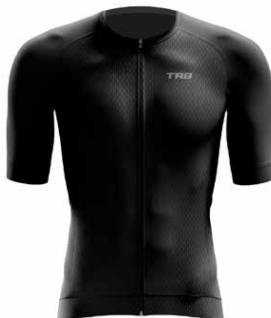
02ELT61 Negro / Black