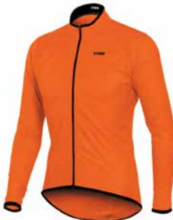
NA20 Naranja neon / Fluor orange