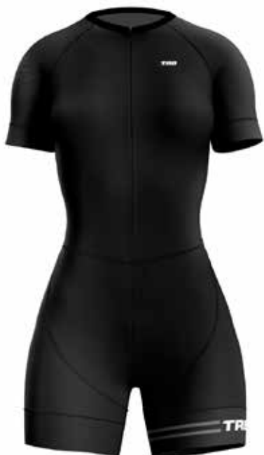
NEG Negro / Black