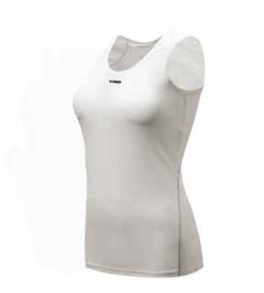
BL20 Blanco / Blanco