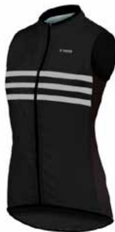
05CHL83 - NEG